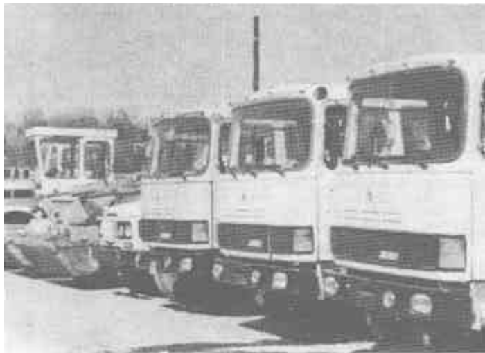
△ 公司势力雄厚,拥有先进施工设备189台(套)。图为部分施工机械。

公司1990年晋升为“施工企业技术资质二级企业”,并先后获农业部全面质量管理达标企业、省系统先进企业、市级先进企业、市十佳企业、明显企业等50多项荣誉称号。成为中国市政工程协会会员,山东省市政协会董事企业。