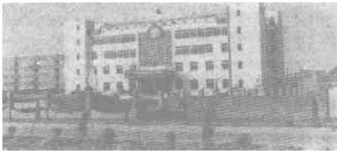
△ 图为公司新落成 的办公大楼

在社会主义市场经济建设中,该公司率先走向市场,闯出国门,参与国际竞争。他们在总经理刘双珉的率领下,从提高职工素质入手,大胆招聘了十几位著名的高级工程师、高级会计师,自费培养了中高级专业人员40多名,强化了质量管理队