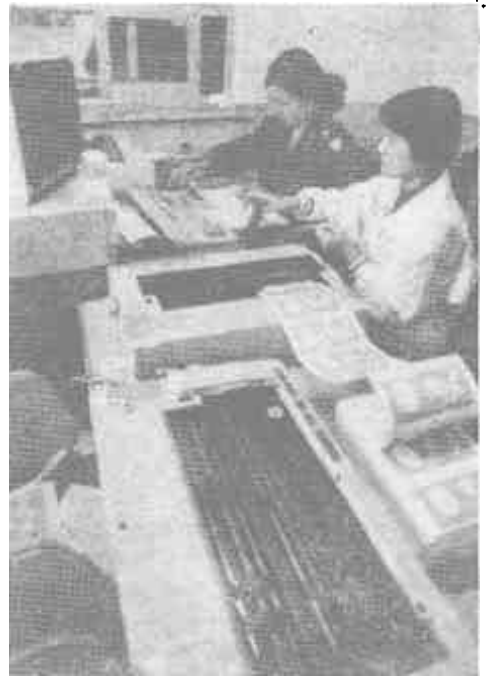
市公路局东营公路站积极推行标准化管理模式，对辖区车辆一律实行微机管理，从而提高了工作效率。一至6月份，全段共完成养路费征收任务226.77万元，比去年同期增长27.83%。