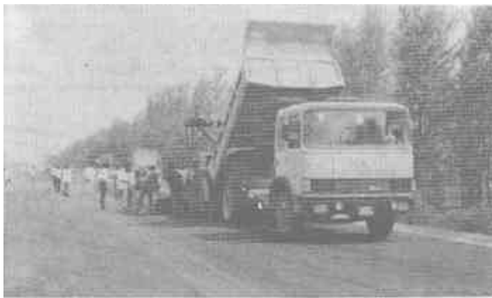
△ 图为公司博新一级路施工现场

几年来,东营市第二市政工程公司坚持了“以转换机制增活力,靠技术进步促效益”的发展方针,连年上台阶、跨大步,自公司创建以来,产值、利税、利润都成倍增长,特别近三年,企业实现了大跨