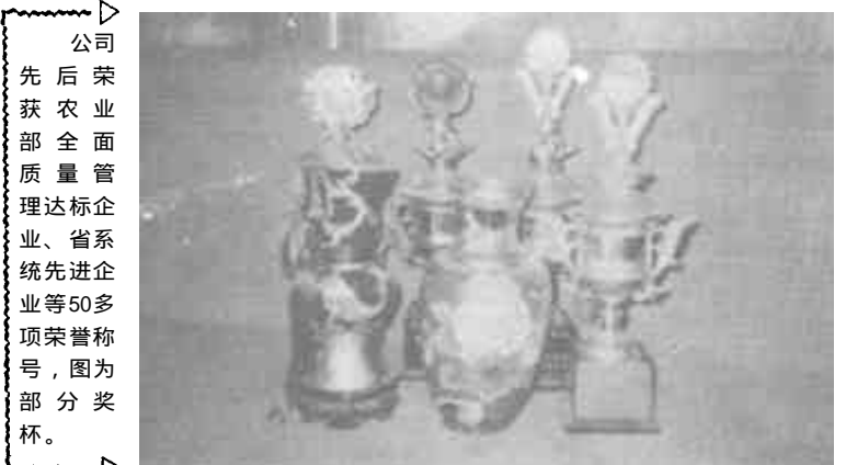
△ 公司先后荣获农业部全面质量管理达标企业、省系统先进企业等50多项荣誉称号,图为部分奖杯。

随着社会主义市场经济的建立和改革开放的不断深入,在竞争中崛起的东营市第二市政工程公司适应形势,迅速转轨变型,走上了自我发展、自负盈亏、自我约束和自主经营之路,成为我市建设系统首家股份制试点企业。